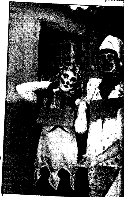
Os jovens do grupo de teatro de Nova Iguaçu, de espetáculos teatrais.

quando eles o novo espaço de Nova Iguaçu: "Anha Haisa". O espaço criado a partir do trabalho do grupo Chico Buarque da presença para montar teatrais